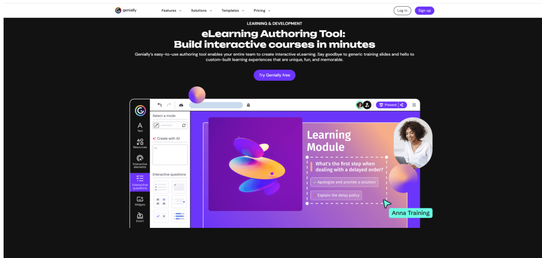
Рисунок 1 – Інтерфейс освітньої платформи Genially для створення інтерактивних навчальних модулів

мультимедійного та методично насиченого контенту, адаптованого під індивідуальні та групові освітні потреби [3, с. 41].