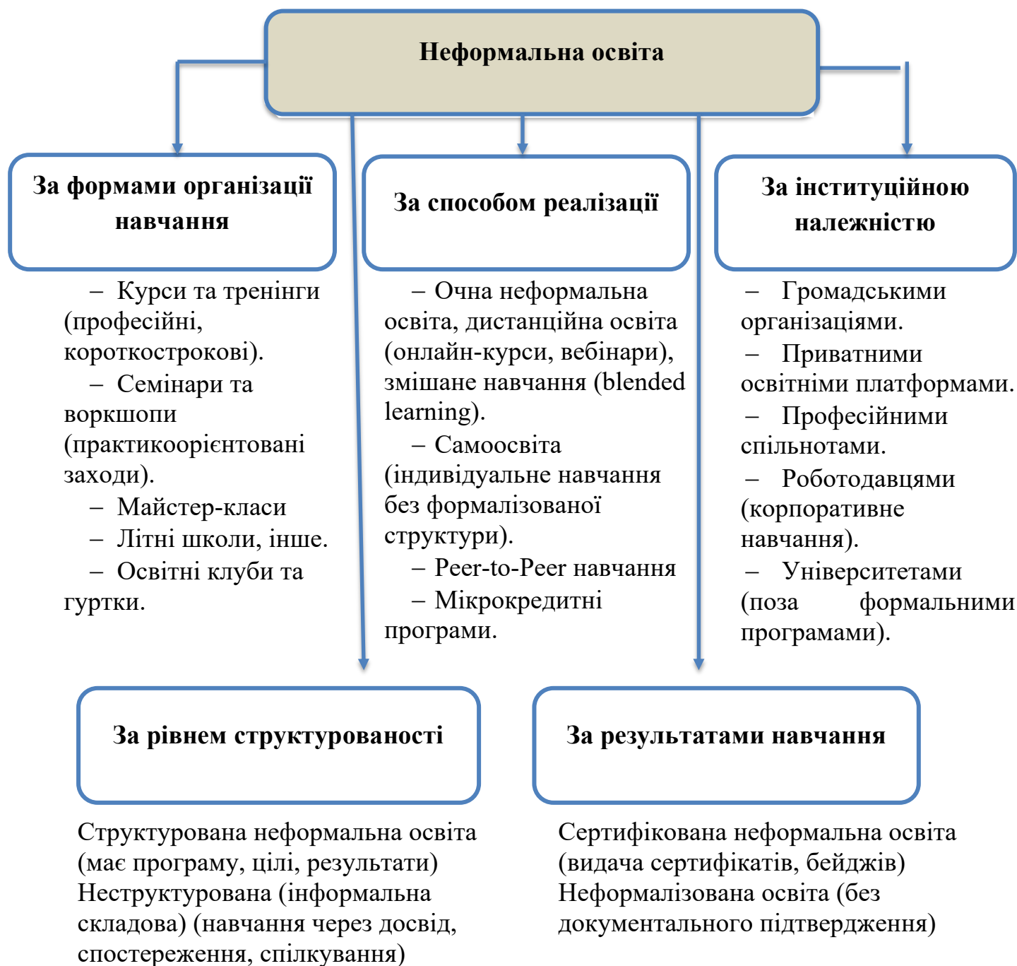
Рисунок 2. Структура неформальної освіти.

Неформальна освіта охоплює широкий спектр організованих освітніх активностей, що здійснюються поза межами формальної системи освіти та спрямовані на набуття професійних, соціальних і особистісних компетентностей. Її ключовими характеристиками є гнучкість, добровільність участі, орієнтація на