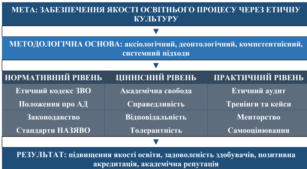
Рисунок 1. Модель етико-методологічного забезпечення якості освітнього процесу у вищій школі*

– від усвідомлення норм через інтеріоризацію цінностей до автономної поведінки – забезпечує сталу етичну компетентність [8, с. 117].