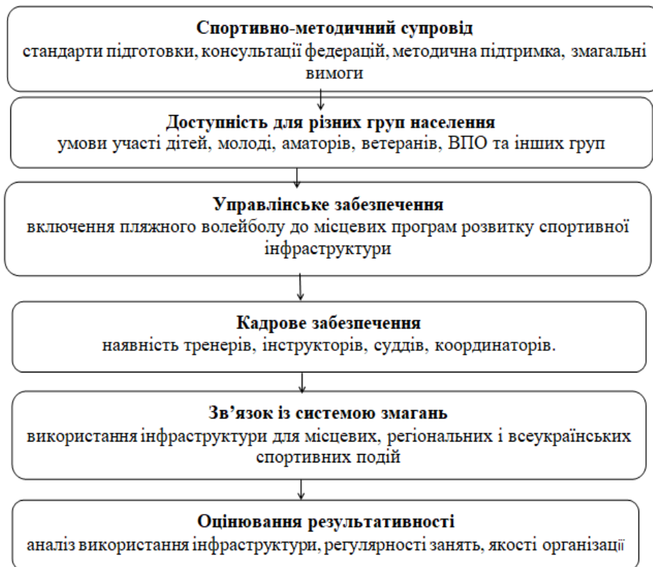
Рис. 2. Організаційні умови взаємодії органів місцевого самоврядування та спортивних федерацій

спортивно-методичним супроводом, доступністю занять, участю у змагальній практиці та оцінюванням результатів. Узагальнення цих умов подано на рис. 2.