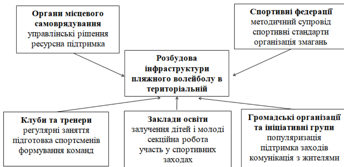
Рис. 1. Суб'єкти взаємодії у розбудові інфраструктури пляжного волейболу